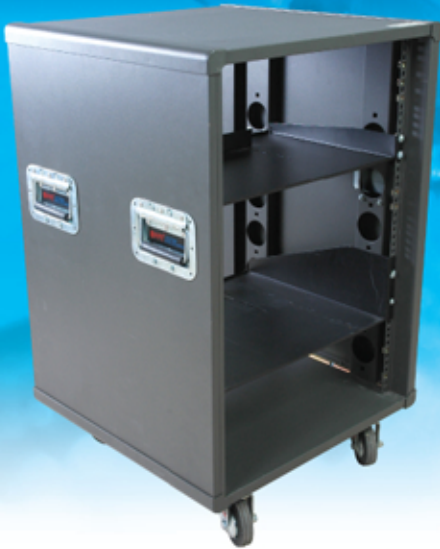
Move Rack 19" MR-16U