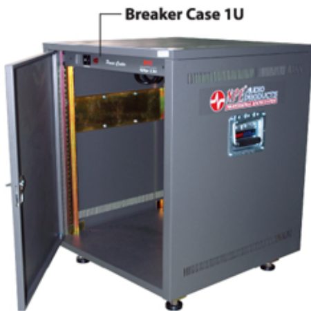
Quick Rack 19" With Panel QRp-13U