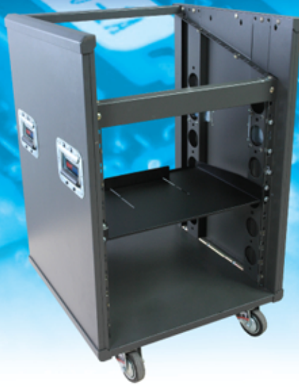
Move Rack 19" With Mixer MRm-12U