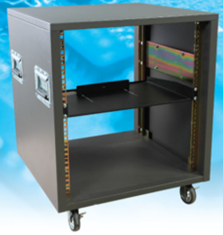
Quick Rack 19" QR-12U